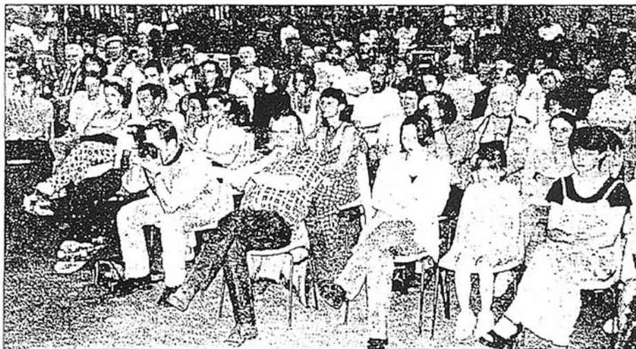
Un monde fou partout dans le vaste jardin public.